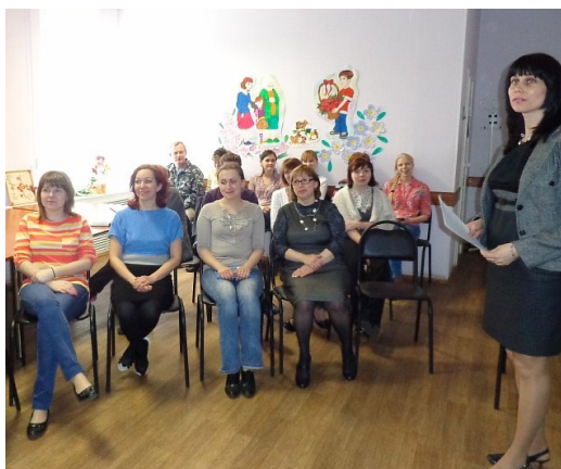
Заместитель директора Центра охраны прав детства проводит с сотрудниками собрание по вопросам охраны труда

В центре помощи совершеннолетним подопечным провели смотр-конкурс на лучшую организацию работ по охране труда среди отделений центра. Уголок об истории праздника Всемирного дня охраны труда на тему «исторический мостик в 60-70-е годы нашей страны. Плакаты по охране труда в СССР».