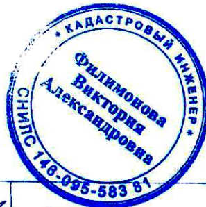
Схема расположения земельного участка или земельных участков на кадастровом плане территории в кадастровом квартале 29:22:081502

Местоположение: Архангельская область, г. Архангельск, Исакогорский территориальный округ, ул. Тяговая, 68